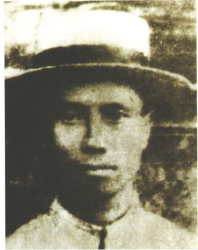
图3.8.11 攻打南京天堡城牺牲的浙军支队敢死队长叶仰高浙 Picture 3.8.11 Ye Yanggao, leader of the fearless detachment of the Zhejiang Army, died in the attack of Tianbaocheng of Nanjing [Zhe]

令。12月1日，指挥镇军会同浙、沪军发起猛攻，次日攻入城内，占领银行、电报局，驻进两江督署，以临时江宁都督名义安民。结果，浙军方面认为他独霸成果，和镇军发生武装冲突。他随即通电，宣布取消镇江都督名义，率镇军撤出江宁，开赴浦口、临淮关一线，就任北伐临淮总司令。后因得罪陈其美等，得不到军费和军火，以致部队不肯开拔，迫不得已赶到扬州求援，又遭冷遇；又到南京、镇江求援，也无所得。1912年1月8日，被迫下野，回乡闲居。1912年9月，被袁世凯授予陆军中将加上将衔。10月到北京，被推为各团体联合国防会副会长。袁世凯任他为总统府军事顾问，国民党也推他为名誉理事。1913年春，袁世凯派人暗杀国民党领袖宋教仁，他非常气愤，当众表示要回南方号召旧部反袁复仇，因而为袁世凯所痛恨。4月10日，袁世凯指使心腹、总统府秘书长梁士诒在宴席上下毒药，他回家后病发，满身脓疱，七窍流血，至16日死亡。